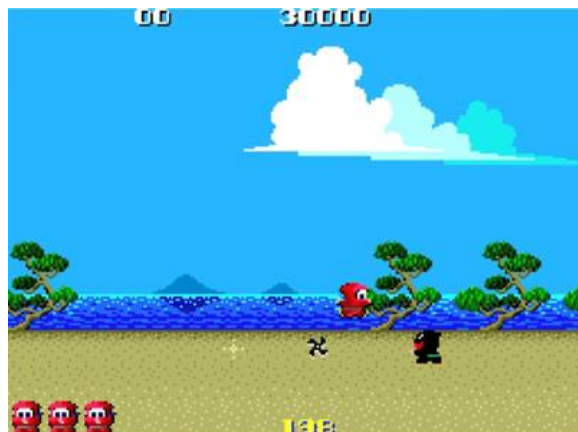
忍者くん 阿修羅ノ章

“PlayStation”は株式会社ソニー・インタラクティブエンタテインメントの登録商標です。